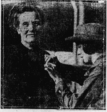
の海ノタスイオ人亡未トルエザルガ... 士迎歡をトウカスルガ