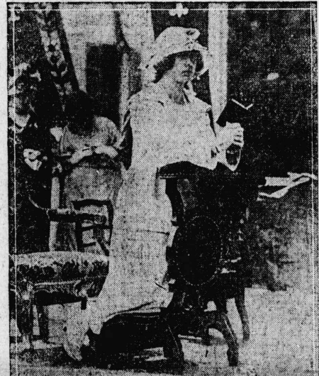
るたりあ約婚御公トトハ子太皇利太伊 王親内アセヨジリマ義耳白