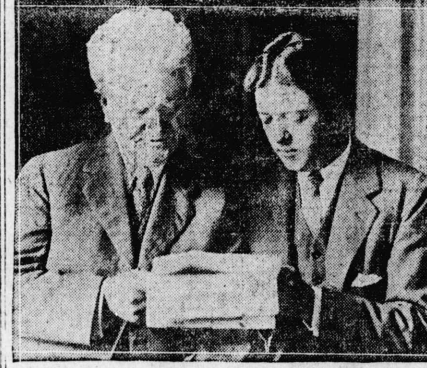
あるつみ説を報電の勤敬授のりも國全 息子トツロフ。ヲ捕執領統大黨三第