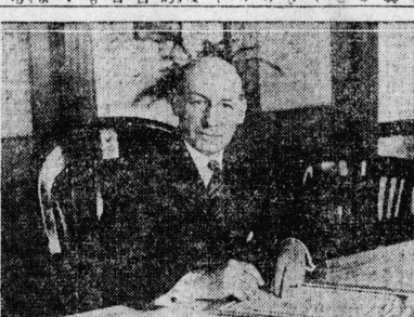
新妻謀議長ハイ子將軍と共和黨選挙宣傳車と大總統演説