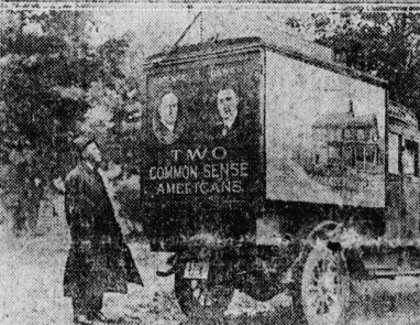
新妻謀議長ハイ子將軍と共和黨選挙宣傳車と大總統演説