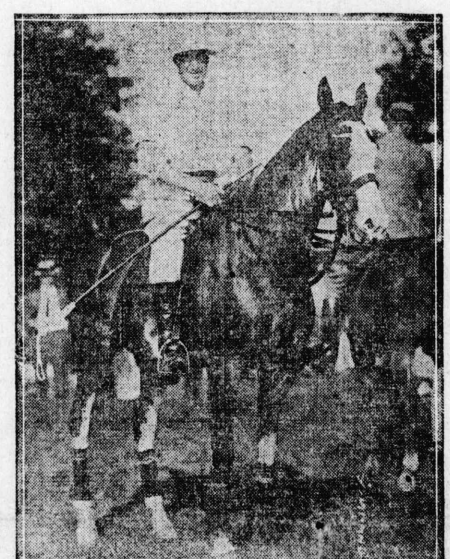
の軍服騎馬國米るけ於技競ボ際國