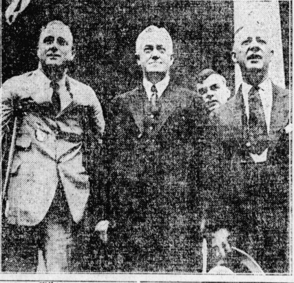
武來頓の夢 武來頓の夢 武來頓の夢