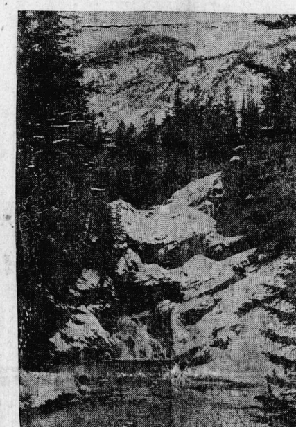
米海軍果して 劣勢乎