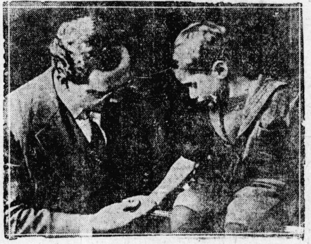
植原大使の肖像... 植原大使の肖像... 植原大使の肖像...