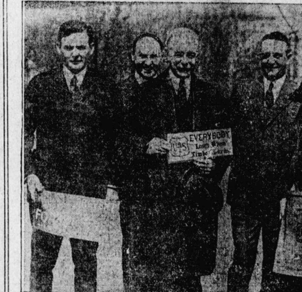
華府に防火宣傳を相談した名士