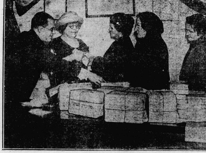
紐育商業會議所はツボスアに祭に太人婦人二百名に

労働内閣の倒壊運動、保守自由兩黨の提携機運。労働内閣の倒壊運動、保守自由兩黨の提携機運。労働内閣の倒壊運動、保守自由兩黨の提携機運。