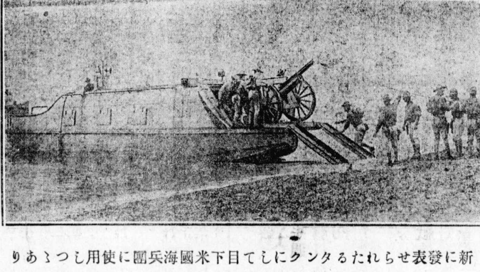
新發表せられたるタゴレーの自筆用紙に用ひたる兵團