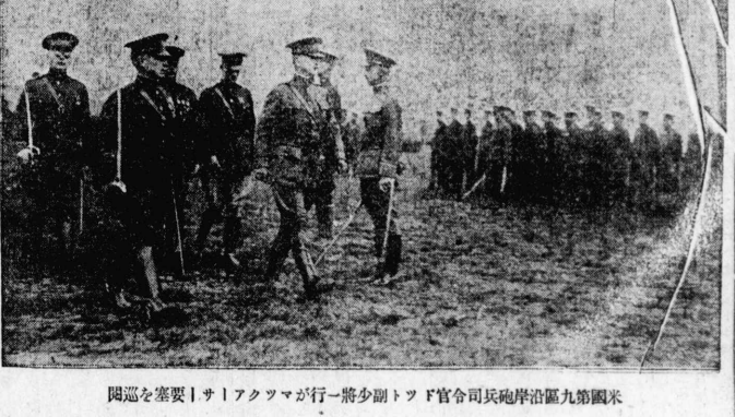
國巡を案要 | サイアツマが行一將少副トフ官司令砲岸泊區九第國米