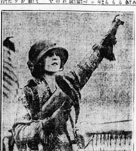
米渡人美の一洲 漆 點高最で票投人美たは行でニドシ洲漆