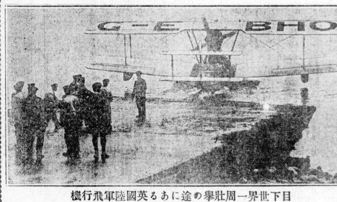
飛行機軍陸國英のみに途の舉壯周一界下世目

米上院は十五日日本移民絶対禁止案を可決し、排日案は上院で満場一致で可決された。同日、上院は排日案に反対する上院議員の意見を採録し、排日案に賛成する上院議員の意見を採録した。排日案は上院で満場一致で可決された。同日、上院は排日案に反対する上院議員の意見を採録し、排日案に賛成する上院議員の意見を採録した。