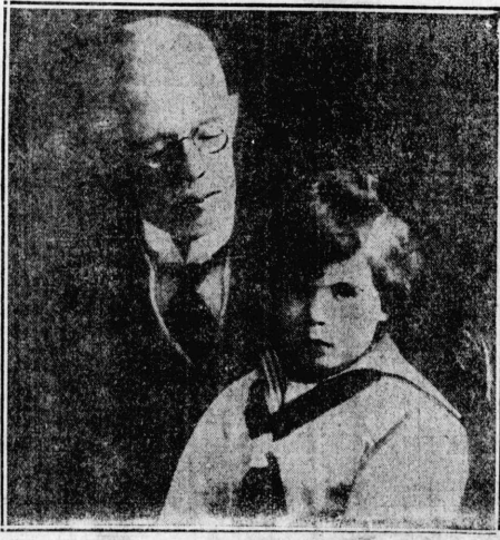
様王典瑞の末未... 今下殿ハヨルルヲ孫王あるはつれは推愛に王典瑞...