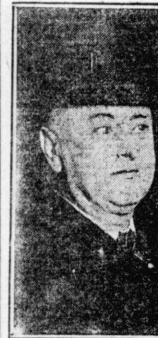
羅馬法王病氣重態