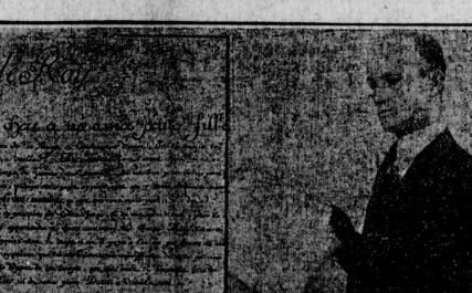
Portrait of a man, likely related to the 'Double Mountain Miscellany' article.