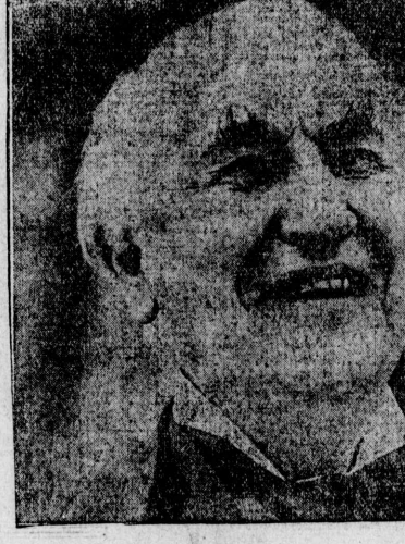
氏ソイデ・スマト... 二十月五日...