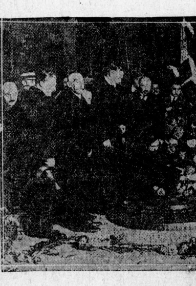
荒野の風景... 永原宵村の作品。...