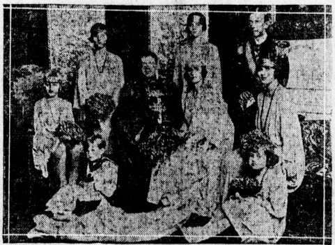
Illustration of a group of people in a rural setting.