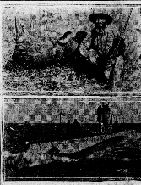
荒野 永原宵村 夫れは、我が國の前途を憂ふ者にして、其の憂ふ所は、我が國の前途に在り...