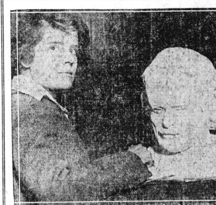
故山中の秋の光景