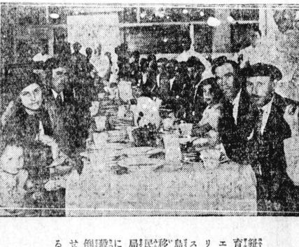
歐州移民の民食 歐州移民の民食...