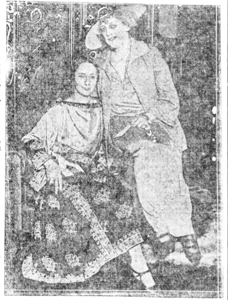
來春來るパロワ嬢