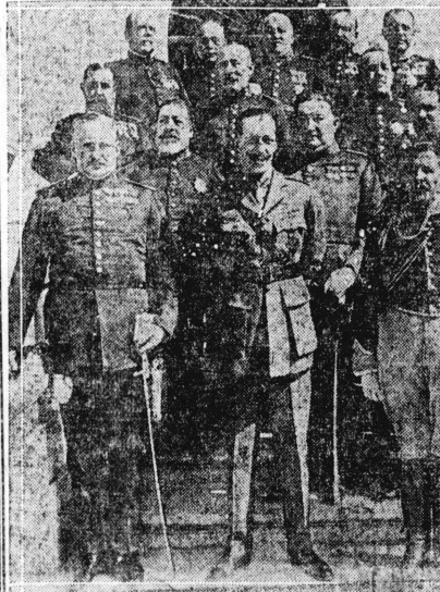
物人心政府断武新帝皇牙班西