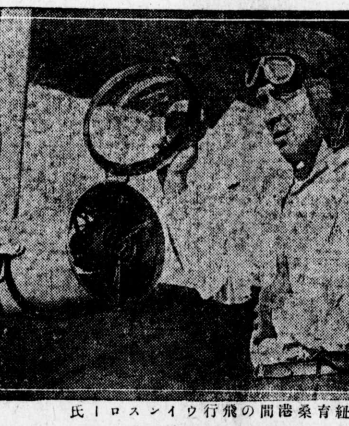
氏ノロソイワ行飛の間港乗育紐