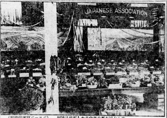
列品出品人本日會連共都回七十第 (影攝館真寫ジョージ)