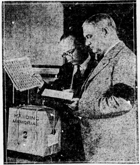
長次局政郵手切念紀領統大へ故