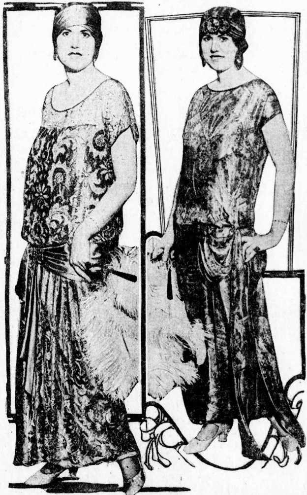
日本の地震から米國婦人流行服の新しい色彩と模様が生れた