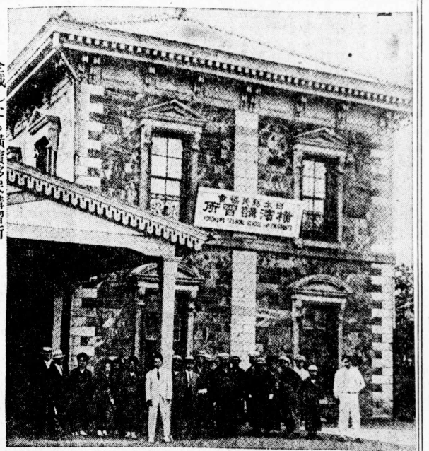
全滅したる横濱移民講習所