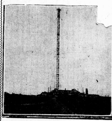
船橋海軍無線電信局