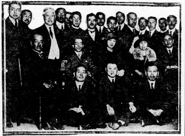
會合聯濟救害災國故