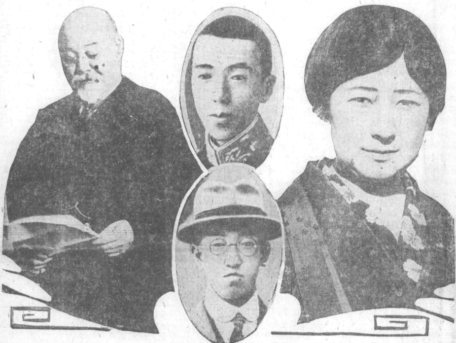
るたれらぞ報てに信電線無趣の難遭御... 子請は橋高義徳會友致るたれらぞ報りたし