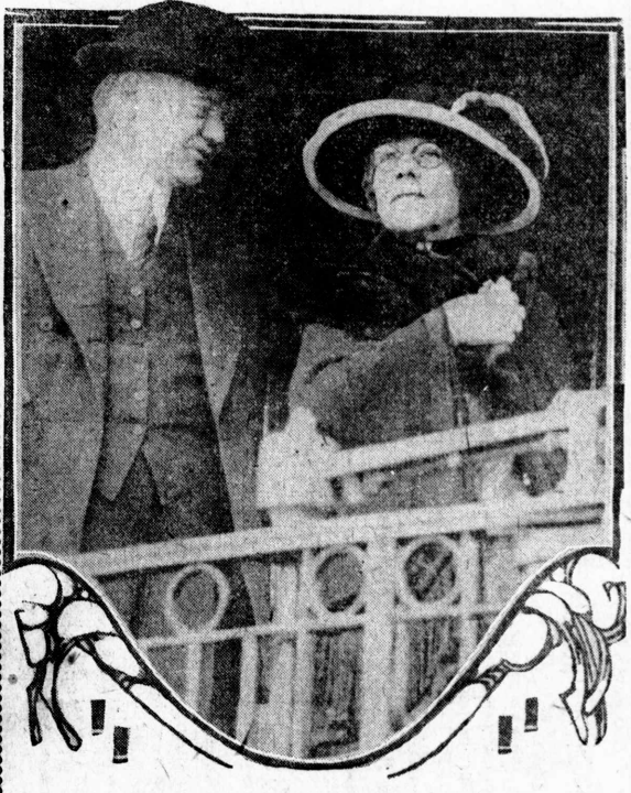
妻夫氏グンイデーハ領統大 攝車停海三第市港朝日九十二月七 所居すさんせ車トリり車列列着着時に