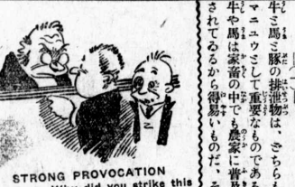
STRONG PROVOCATION Judge: Why did you strike this man? Street Car Conductor: Judge, he called me a sardine packer, and I won't stand for that!