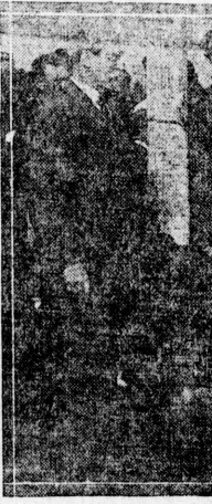
手選球杖と脚務國...