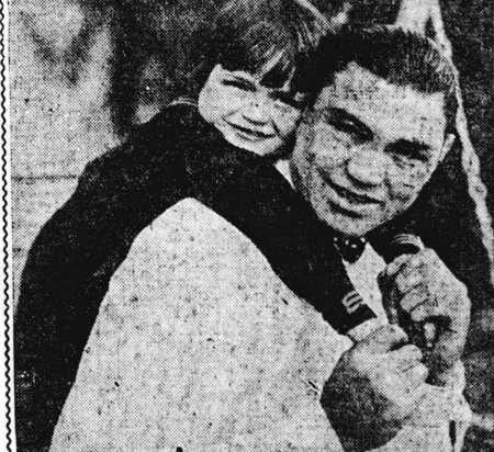
子供役者の大人激励