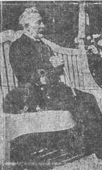
帝皇逸獨前の近最