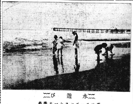
遊水 桑港オーシャンビーチにて