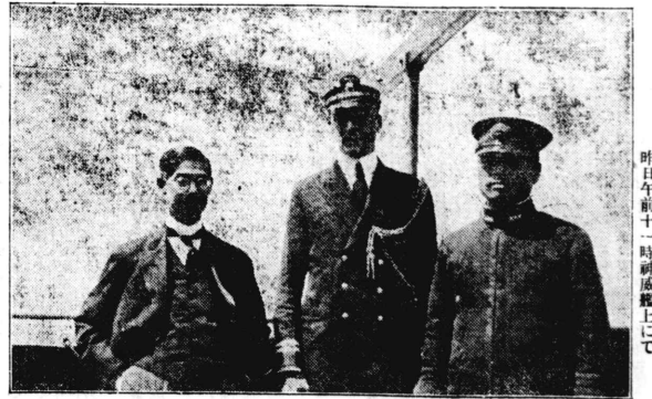
「神威」の公式訪問 昨日午後二時、神威艦上にて