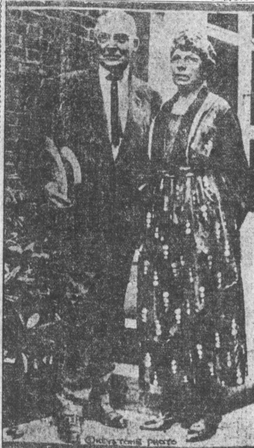
Osaka Press photo