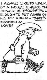
渡日す 東ヶ崎 渡日す