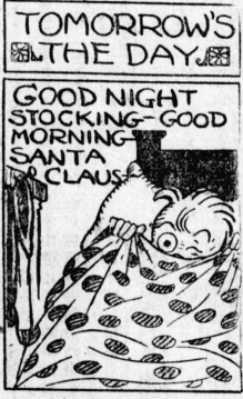
TOMORROW'S THE DAY GOOD NIGHT STOCKING-GOOD MORNING SANTA CLAUS