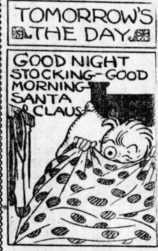
TOMORROW'S THE DAY GOOD NIGHT STOCKING-GOOD MORNING SANTA CLAUS