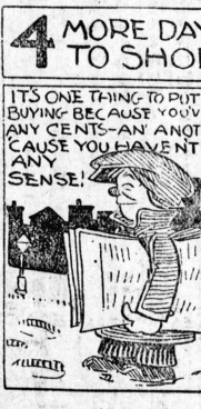
4 MORE DAYS TO SHOP

IT'S ONE THING TO PUT OFF BUYING BECAUSE YOU HAVE NOT ANY CENTS-ANOTHER CAUSE YOU HAVE NO SENSE!