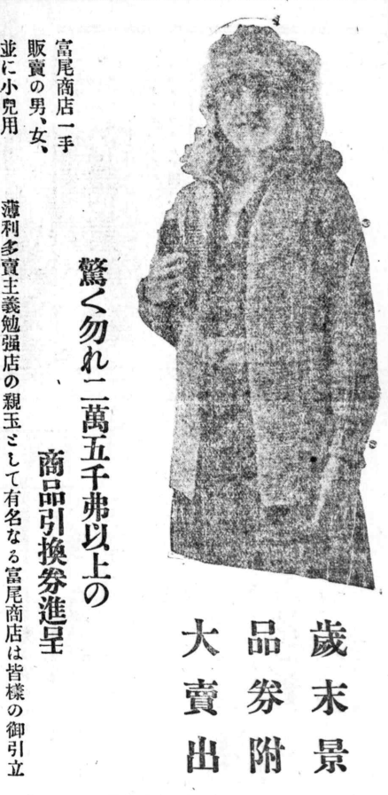
驚く勿れ一萬五千弗以上の 商品引換券進呈