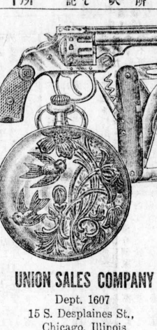
UNION SALES COMPANY Dept. 1607 15 S. Desplaines St., Chicago, Illinois