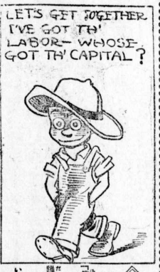
LET'S GET TOGETHER. I'VE GOT THE LABOR WHOSE GOT THE CAPITAL?