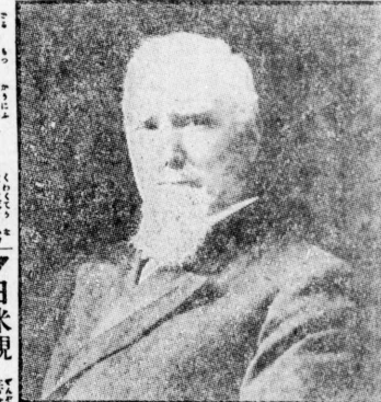
ダラー氏(左)と米青年會の職員ら

本邦基督教青年會の指導者として、邦人基督教青年會の擴張を米人間に熱心に奔走したダラー氏(左)と米青年會の職員ら。ダラー氏は、米青年會の指導者として、邦人基督教青年會の擴張を米人間に熱心に奔走した。ダラー氏は、米青年會の指導者として、邦人基督教青年會の擴張を米人間に熱心に奔走した。