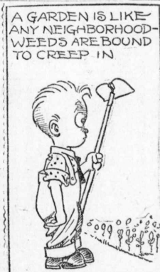
A GARDEN IS LIKE ANY NEIGHBORHOOD WEEDS ARE BOUND TO CREEP IN