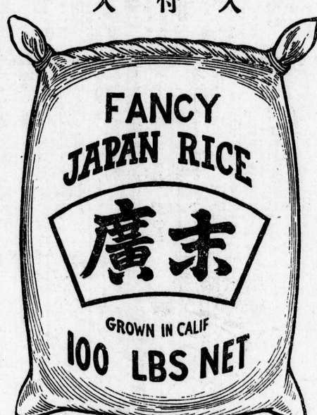
(りあに店料食の處る到)