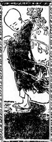
間山 (二八四) 中里介山作