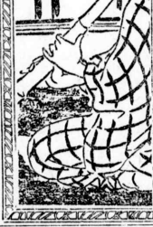
間(山)の山 中里介山作

間(山)の山 中里介山作 このだけの用で七兵衛はまた東 三の待同志が其をきつかに