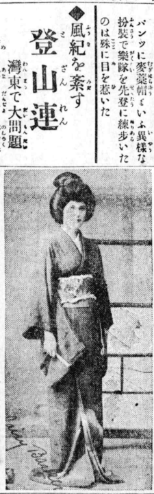
日本米國と仲よくなる事を...