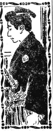
問の山 (後編) 六二八 中里生