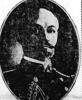
日本親善論を超越して

各種社會改良團體の年會。各種社會改良團體の年會。各種社會改良團體の年會。各種社會改良團體の年會。