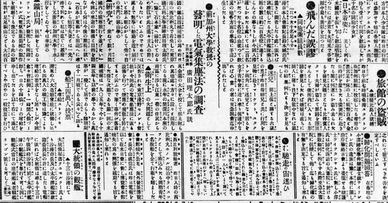
日本少女隊の列進を歓迎する市街の一角