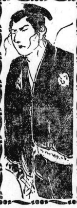
問の山 (後編) 四八〇 中里生

この文字を見た時に、私は、 「お、これは何村の山か？」 と、尋ねた。 「これは、東山梨の山だ。」 と、答へた。 「東山梨の山か？」 と、尋ねた。 「東山梨の山だ。」 と、答へた。