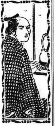
間山 (後編) 四七 中里生